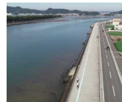
日本遺産和歌の浦