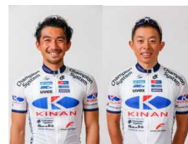
キナンサイクリングチーム