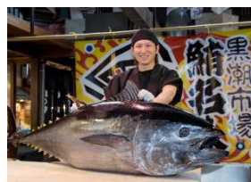
マグロ解体ショー

地元和歌山のよさこい演舞や獅子舞をはじめ、屋台村や自転車メーカーの展示試乗会などの充実した内容です。さらに17時からの開会セレモニー終了後には、マグロ解体ショーや和歌山の「うまいもん」グルメのふるまいを行います。