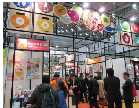
【前回の和歌山県ブースの様子】