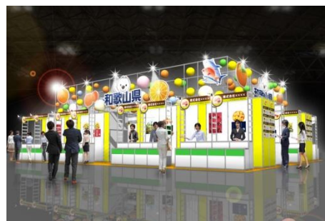
【和歌山県ブースイメージ】