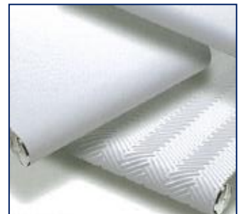
食品産業向けベルト