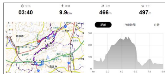
モデルコース例（ルート⑩：明神山から亀の瀬）