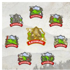
バッジデザイン（全8種）