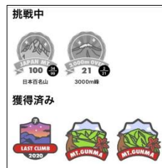
アプリ内バッジページイメージ