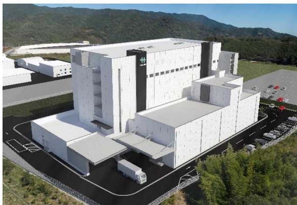
増設後の紀ノ光台工場イメージ (手前にある建物を増設)