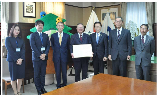
和歌山県民共済生活協同組合、大辺路森林組合、土地所有者様、白浜町、和歌山県による記念撮影