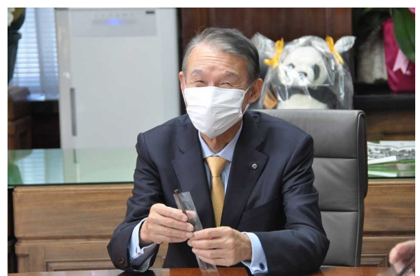
チョコストローを手取る岸本知事