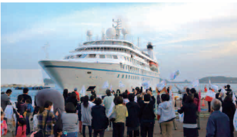
新宮港に寄港したクルーズ船

答 クルーズ船の観光客を歓迎する機運を醸成し、おもてなしの向上や経済波及効果の拡大につながるため、県民にクルーズ船という旅行手段を知ってもらう取組も必要と考えます。このため、寄港地周辺市町によるイベントの開催やホームページでの情報発信により、クルーズ船を身近に感じてもらう取組を進めています。