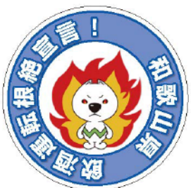
飲酒運転根絶ステッカー

答 全国状況としては、16道府県で条例が制定されています。中でも福岡県の条例には飲酒運転をした者や酒類提供者への罰則等を科す規定があることから、その内容や適用状況、効果等を参考とし、平成31年2月定例会での制定を目的に検討しているところです。