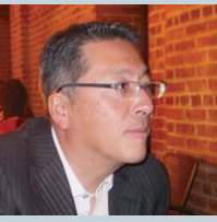
なかむら ゆういち 中村 裕一 会派 自由民主党県議団

みんな元気になろう！和歌山には自然や文化がいっぱいあって、世界中に自慢できる素晴らしい観光地。