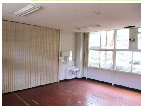
1F 職員室 33.4㎡