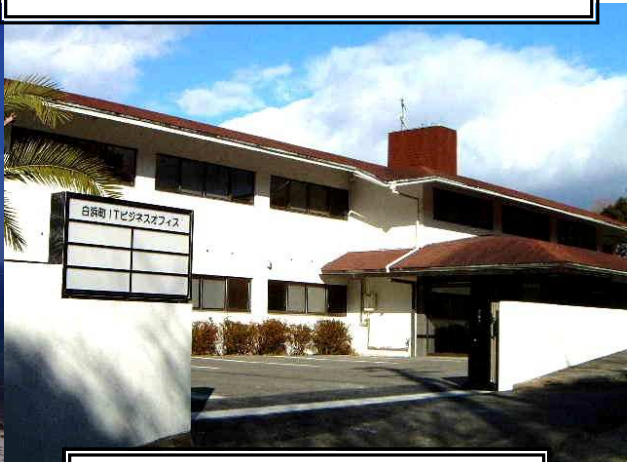
白浜町ITビジネスオフィス 白浜町白浜 ※高台にあります。