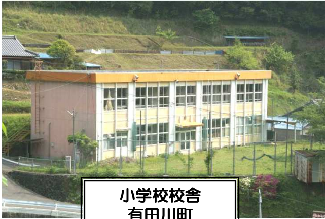
小学校校舎 有田川町