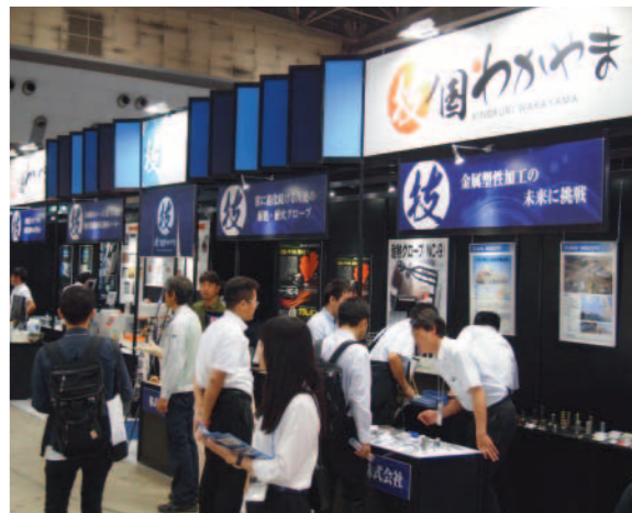
機械要素技術展(東京)

今後も拡大するEC市場への参入を促進するため、販売手法や刻々と変わるEC業界の動向を学ぶ講演会、国内外での競争力強化・売上拡大の戦略などを学ぶ講習会を開催します。