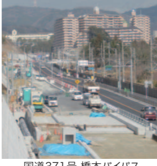
国道371号 橋本バイパス (国体までに開通予定)

府県間道路 関西国際空港へのアクセス向上、大阪府との交流・連携、観光振興などを図るため、県北部地域と大阪府南部地域を放射状に結び京奈和自動車道と一体的に整備します。