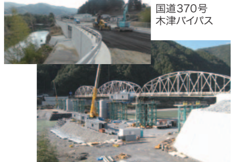
国道370号 木津バイパス

X軸・川筋 ネットワーク道路 高速道路と併せて県内の一体的発展をめざす内陸部骨格道路を整備しています。平成24年にX軸ネットワーク道路の整備が完了し、現在は県内の主要河川沿いの道路を「川筋ネットワーク道路」として平成29年度をめどに整備を進めています。