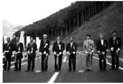
⑥ 国道424号(修理川バイパス)開通式典 「X軸ネットワーク」(高速道路を補完する幹線道路網)を形成する重要路線の供用開始