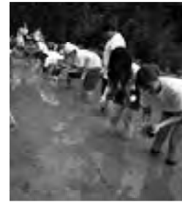
② 「企業のふるさと」での 田植え風景