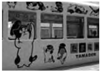
① 和歌山電鉄貴志川線「たま電車」