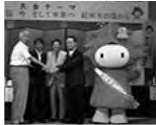
⑤ 「第62回全国植樹祭」 和歌山県実行委員会設立総会