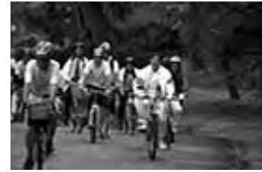
③ COP15 2009コペンハーゲン会議に 向けたエコアピールサイクリングツアー