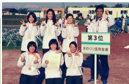
（全日本実業団大会で3位入賞のきのくに信用金庫チーム）