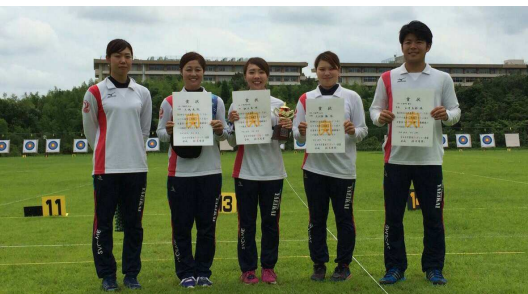
（全日本実業団大会で6位入賞の医療法人彌栄会チーム）