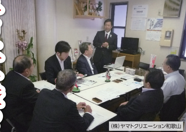
(株)ヤマトクリエーション和歌山