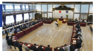
平成28年6月定例会開会の様子

平成29年2月定例会のうち、3月2日(木)*の日程の一部を昨年復原整備された旧県議会議事堂(岩出市根来2347-22)で開催します。 *日程は予定ですので、変更されることがあります。なお、開催時間等については、県議会ホームページをご覧ください。か、県議会事務局議事課(☎073-441-3570)までお問い合わせください。