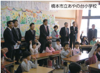
橋本市立あやの台小学校

文教委員会では、平成28年11月29日に県内調査を行いました。 橋本市立あやの台小学校では、授業を見学した後、橋本市教育委員会や学校長から橋本市学力向上推進プランやスクールアクションプラン、家庭学習の推進などの説明を受け、取組に対する課題や問題点などの意見交換を行いました。 また、和歌山市立藤戸台小学校でも、授業を見学した後、和歌山市教育委員会や学校長からマイテーマによる研究の推進や和歌山大学教育学部との協力・連携などの説明を受け、意見交換を行いました。 委員会では、今後とも、子供達の学力向上など、県教育の充実に取り組んでいきます。