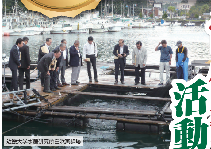
近畿大学水産研究所白浜実験場