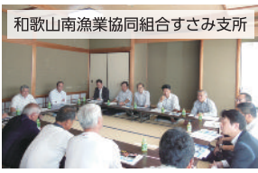
和歌山南漁業協同組合すさみ支所

農林水産委員会では、平成28年10月5日から6日にかけて県内調査を行いました。 白浜町の近畿大学水産研究所白浜実験場、同水産養殖種苗センター、フィッシュマンズワーフ白浜、京都大学フィールド科学教育研究センター瀬戸臨海実験所、那智勝浦町の紀州勝浦漁業協同組合、県土砂災害啓発センター、すさみ町の和歌山南漁業協同組合すさみ支所、株式会社かつら木材商店の計8か所において、現状、課題等について関係者から説明を受け、意見交換や現場の視察を行いました。 委員会では、調査で得た貴重な情報を参考にし、今後とも、所得の安定化や担い手の確保等、農林水産業の成長産業化と活力ある農山漁村の実現に取り組んでいきます。