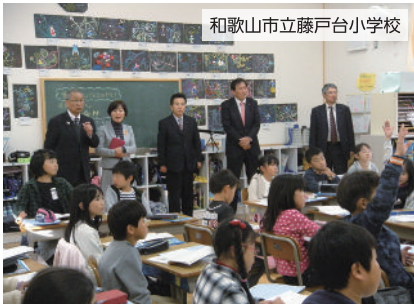
和歌山市立藤戸台小学校