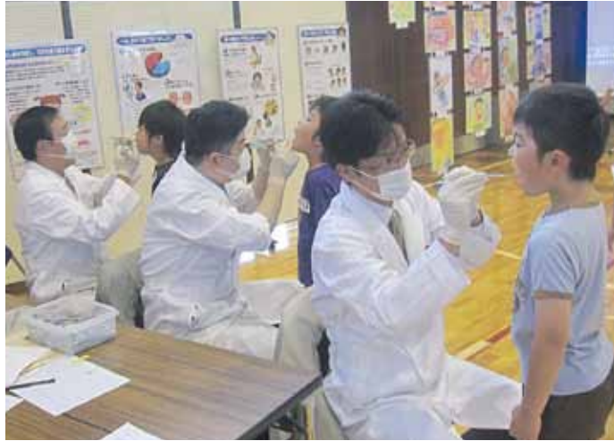
「よい歯を育てるコンクール」審査風景

主な記事 2～3面 平成23年12月定例会概要 4面 議会活動／常任委員会活動レポート 県議会からのお知らせ