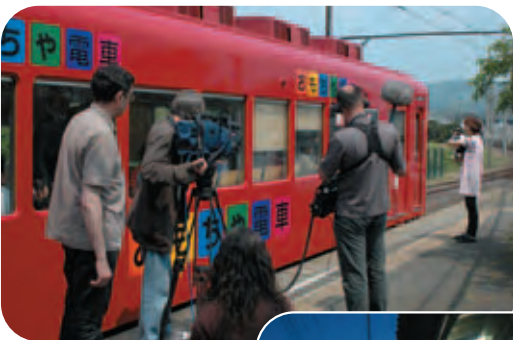
フランスのテレビからも注目される和歌山電鐵 たま駅長(紀の川市)

今回の改正では、同規模県の平均定数削減率に匹敵する4人の定数削減を行うことができ、併せて逆転選挙区の解消、一票の格差の大幅縮減を果たすことができましたので、県民の皆さんには一定の評価をいただけるものと思います。