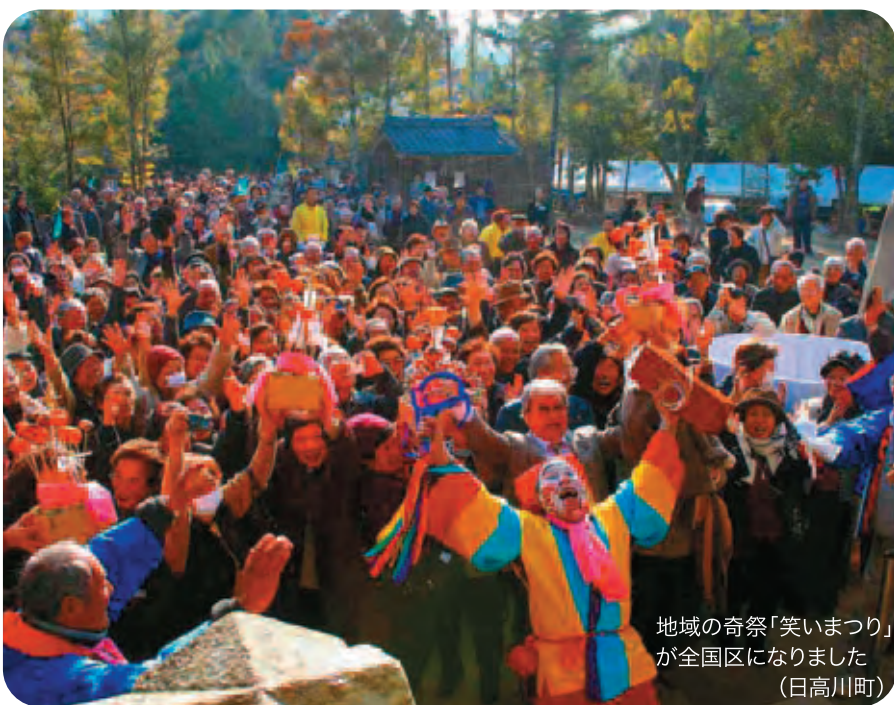
地域の奇祭「笑いまつり」 が全国区になりました (日高川町)

この条例は、観光立県の実現のため、 県民総参加で観光振興に取り組むための よりどころとなるものです。