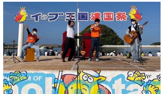
昨年のイノブータン王国建国祭の様子