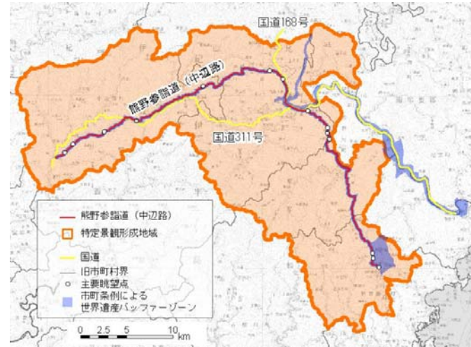
図1 特定景観形成地域 区域図

当該地域の良好な景観形成を図るため、景観条例と並行し、屋外広告物条例による規制区域に指定するものです。