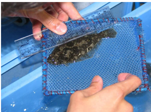
放流前ひらめ稚魚の測定