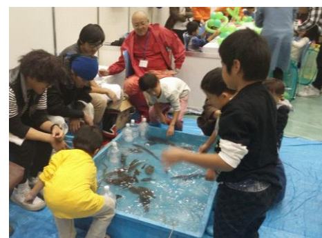
漁業士連絡協議会によるタッチプール