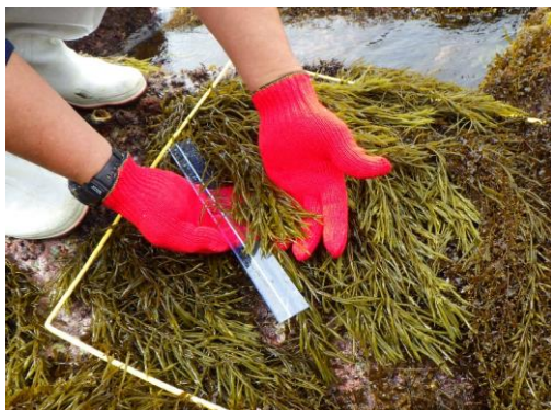
ひじき場の造成(磯掃除後の生育調査)