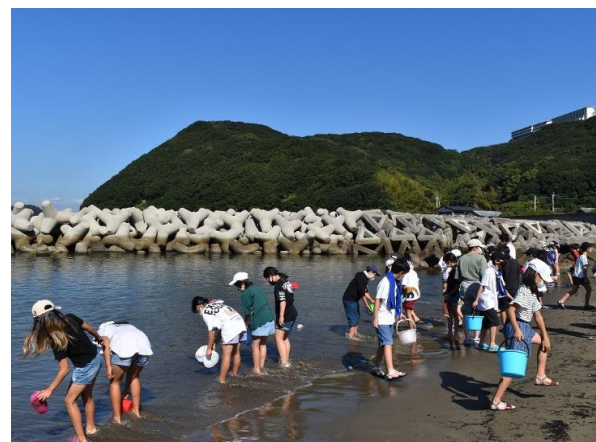
いさき稚魚の放流体験