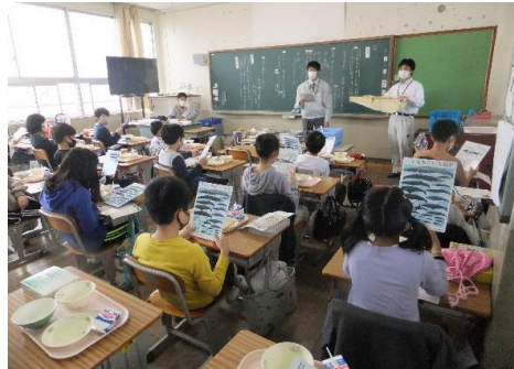
くじらの出前授業