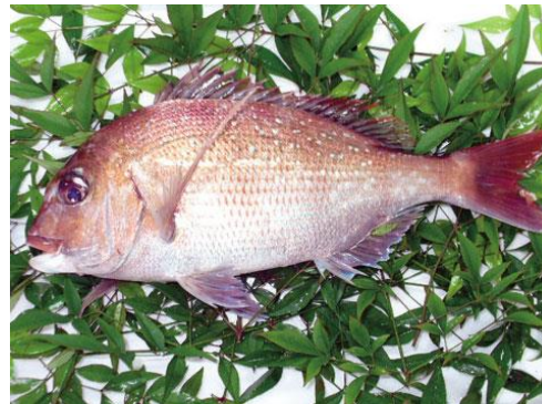
加太の一本釣り真鯛