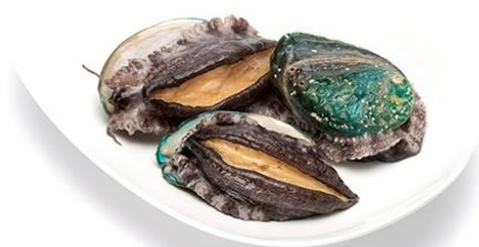
紀州アワビ紀和味(養殖)