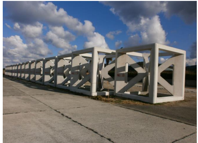
コンクリート魚礁