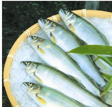
紀州仕立て鮎(養殖)