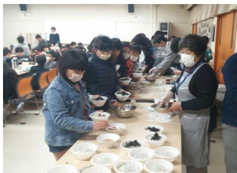
漁協女性部による郷土料理の提供