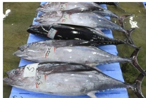
さくらびんちょう