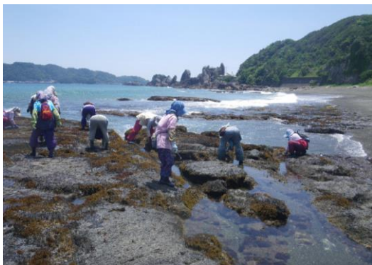
ひじき場の造成(磯掃除)