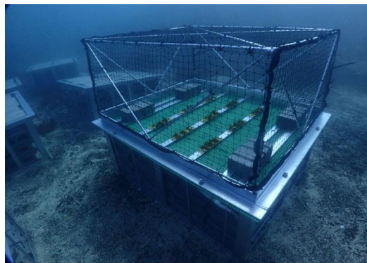
かじめ場の造成(種苗設置)