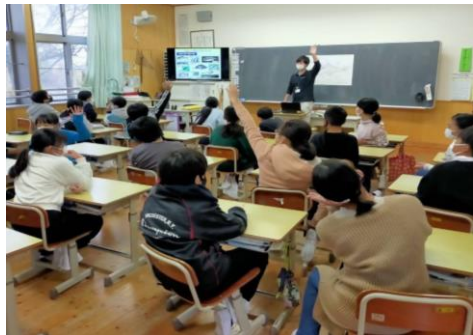
「魚の骨を知って楽しくおいしく食べよう」出張講座