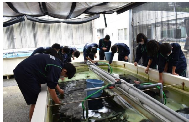
あわび類稚貝への給餌体験