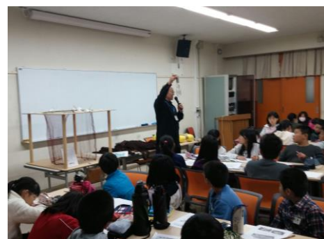
漁業士連絡協議会による魚食普及活動