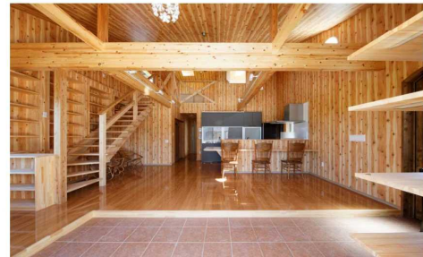
人が集まり賑わいを感じさせる変化に富んだ空間