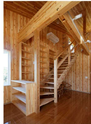
オープンな階段と壁一面の棚