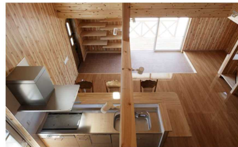
2階からLDKを見下ろす