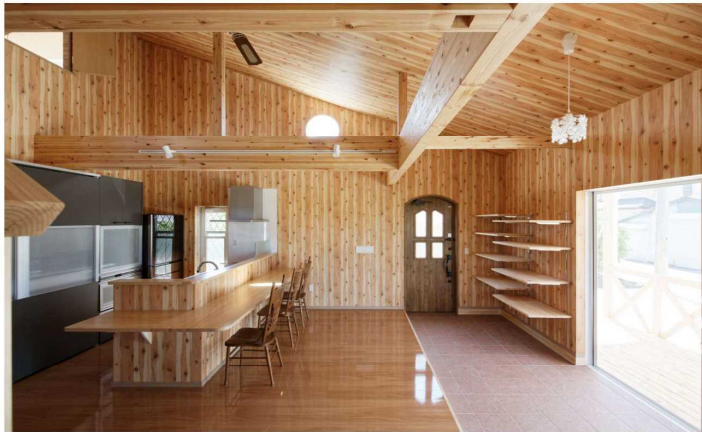
エントランスと一体となった広々LDK