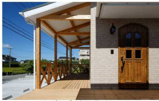
広いデッキスペース