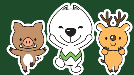
和歌山県PRキャラクター 「ぎいちゃん」

わかやまジビエとは、和歌山県内で捕獲され、食品営業許可を得た県内施設で処理加工された野生イノシシ肉及びシカ肉のことを指します。これらを地域資源として活用するため、平成20年度から県の鳥獣被害防止対策の一環として、需要や供給の拡大、安全・安心の確保等の対策に取り組んでいます。