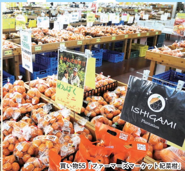
買い物55「ファーマーズマーケット紀菜柑」