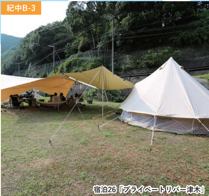
宿泊26「プライベートリバー津木」