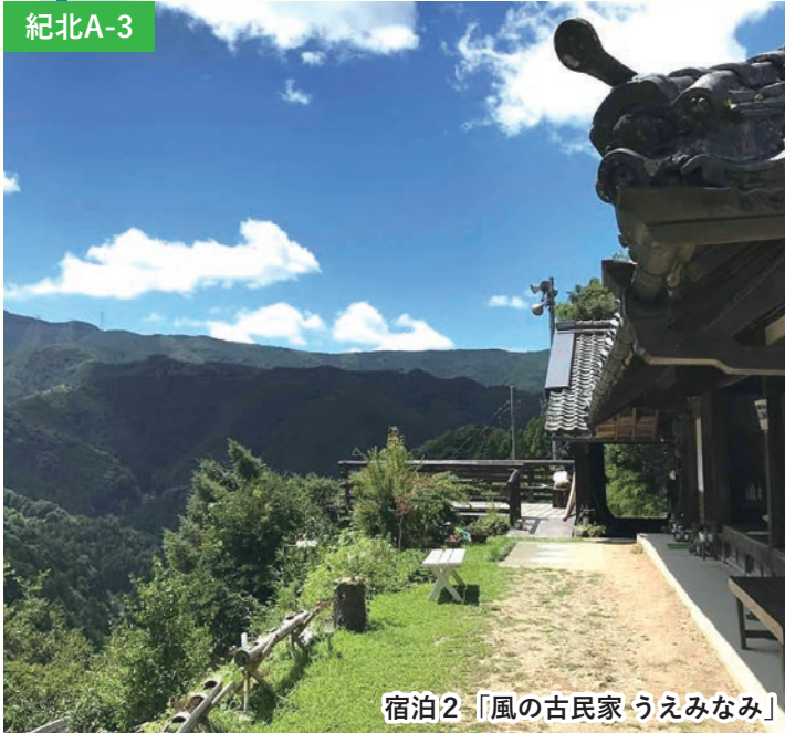
宿泊2「風の古民家 うえみなみ」