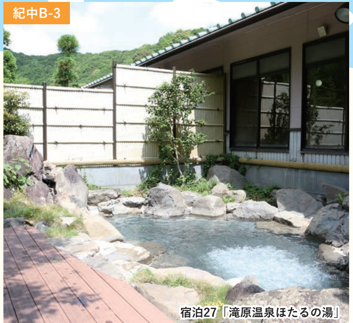
宿泊27「滝原温泉ほたるの湯」