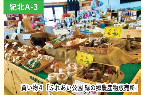
買い物4 「ふれあい公園 緑の郷農産物販売所」