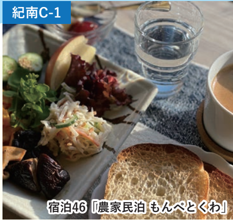
宿泊46「農家民泊 もんべとくわ」