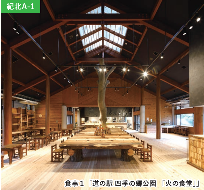
食事1「道の駅 四季の郷公園 「火の食堂」