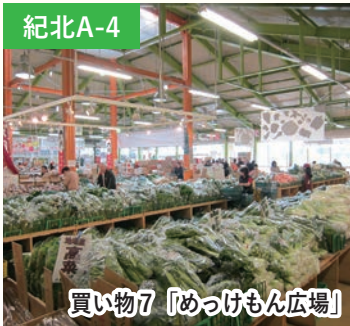
買い物7 「めっけもん広場」