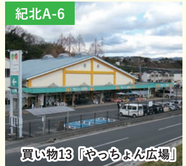
買い物13 「やっちゃん広場」