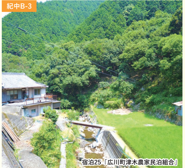
宿泊25「広川町津木農家民泊組合」