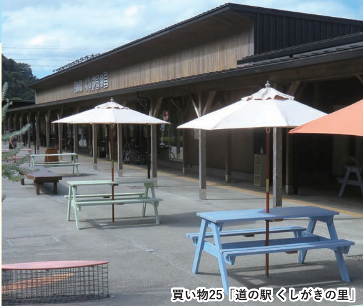
買い物25「道の駅くしがきの里」