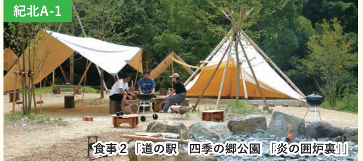
食事2「道の駅 四季の郷公園 「炎の囲炉裏」