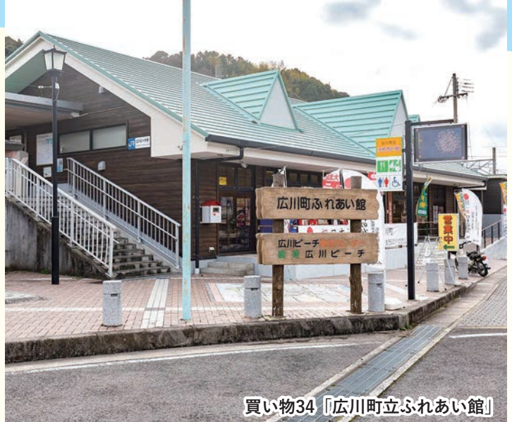
買い物34「広川町立ふれあい館」