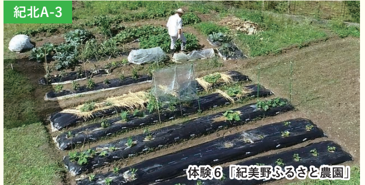
体験6 「紀美野ふるさと農園」