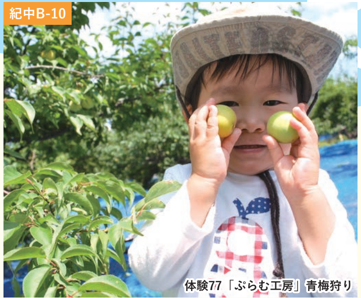
体験77「ぶらむ工房」青梅狩り