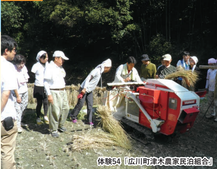
体験54「 広川町津木農家民泊組合 」