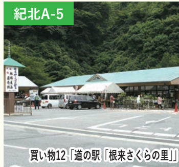
買い物12 「道の駅「根来さくらの里」