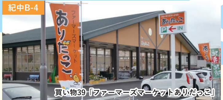
買い物39「ファーマーズマーケットありだっこ」