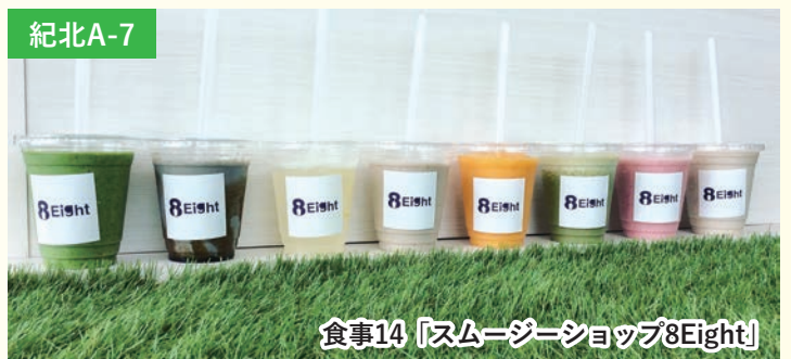
食事14「スムージーショップ8Eight」