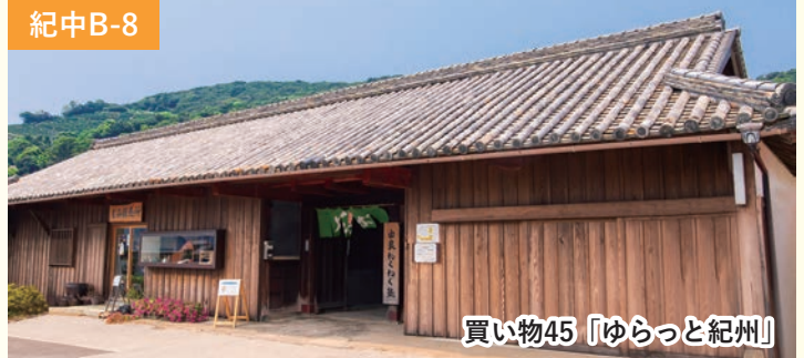
買い物45「ゆらっと紀州」