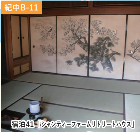
宿泊41「シャンティーファームリトリートハウス」