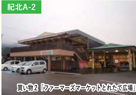
買い物2 「ファーマーズマーケットとれたて広場」