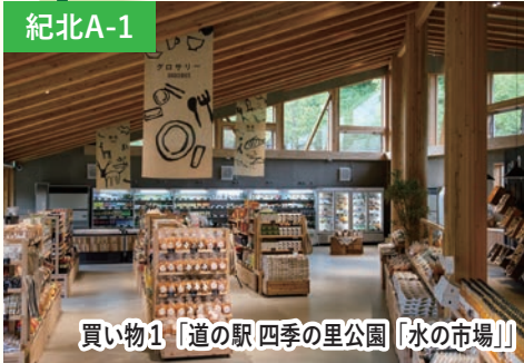
買い物1 「道の駅 四季の里公園」 「水の市場」