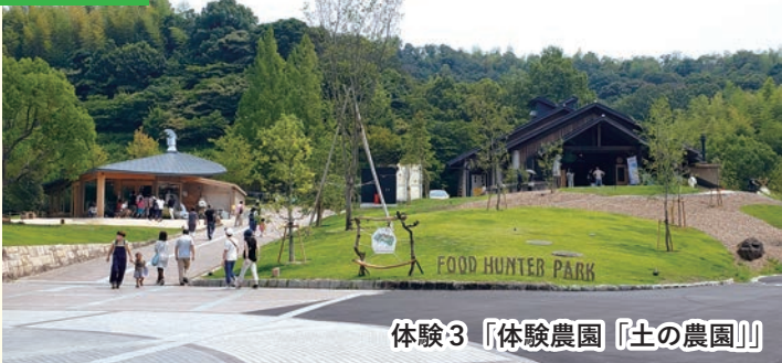
体験3 「体験農園『土の農園』」