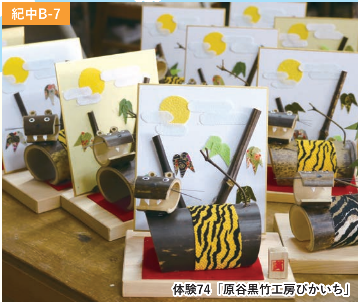
体験74「原谷黒竹工房ぴかいち」