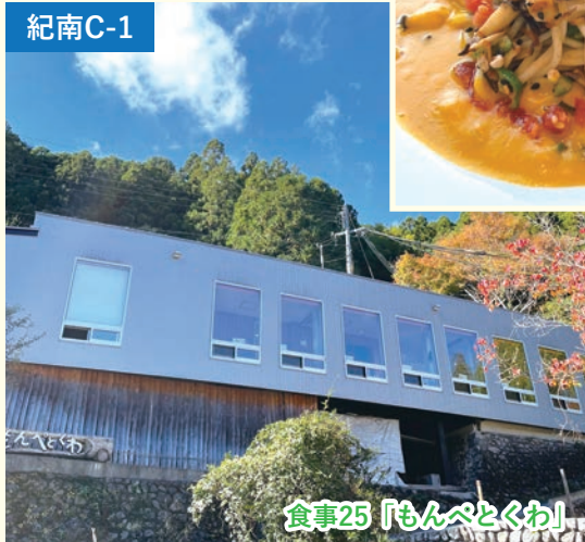
食事25「もんぺとくわ」