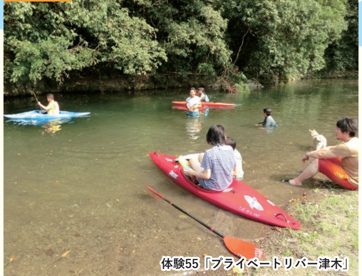
体験55「 プライベートリバー津木 」