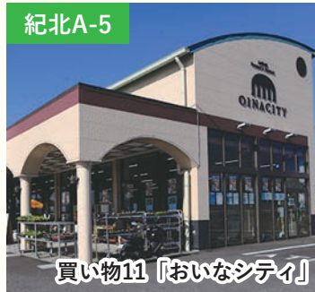
買い物11 「おいなシティ」