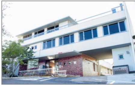
ITビジネスオフィス 「ANCHOR」(アンカー)