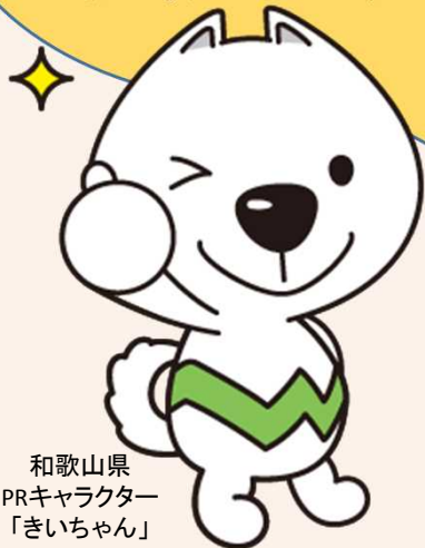
和歌山県 PRキャラクター 「きいちゃん」