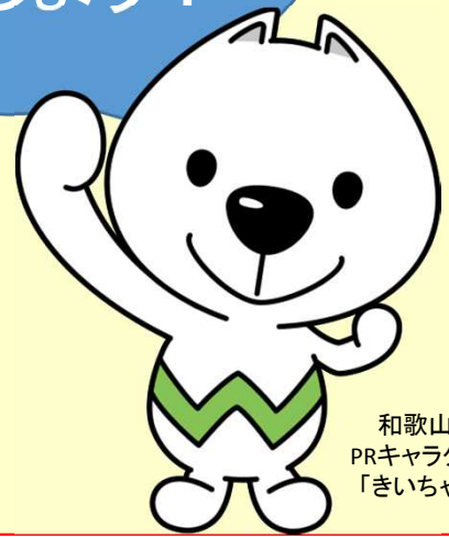
和歌山県 PRキャラクター 「きいちゃん」