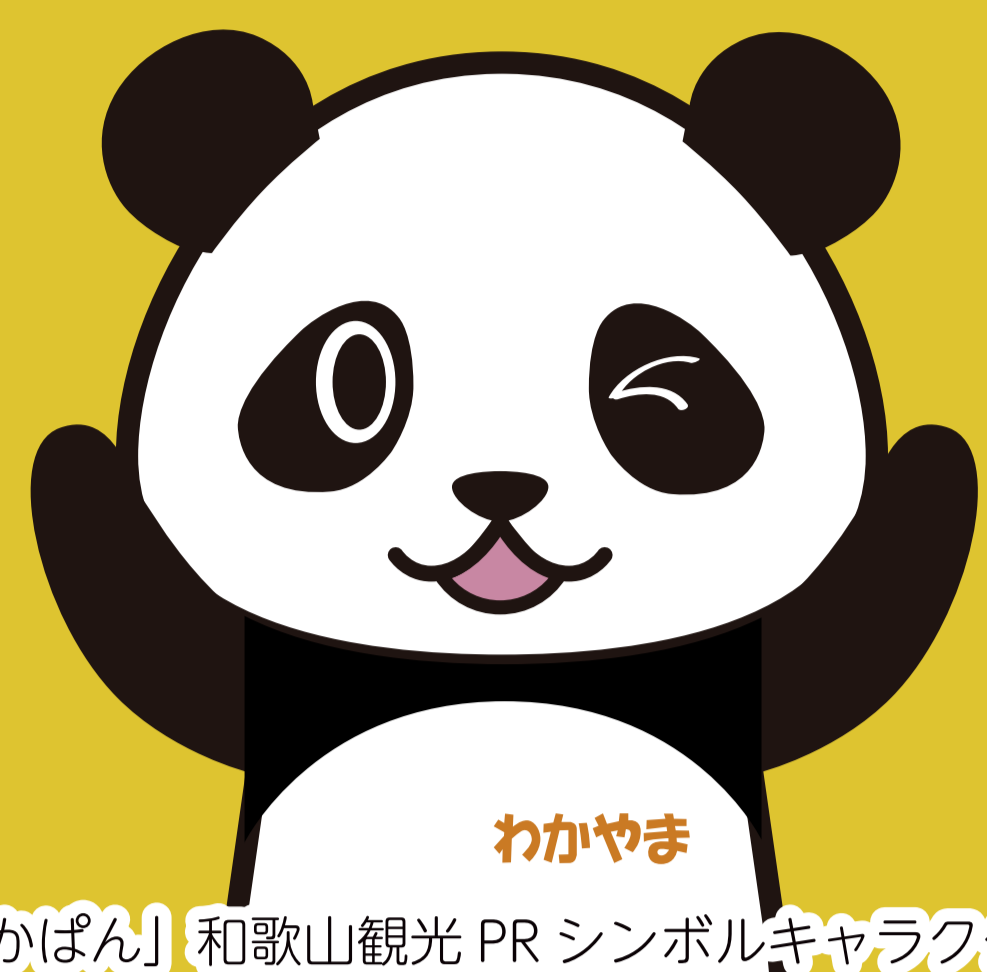
「わかぼん」和歌山観光 PR シンボルキャラクター