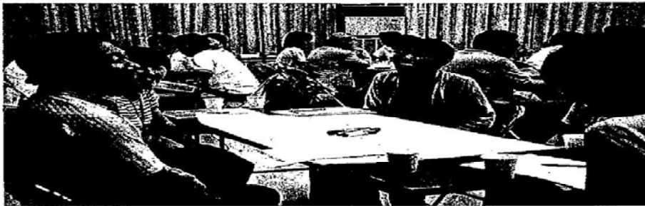
医療、介護の現場で働く両者が歓談しながら意見交換した —22日、新宮市職業訓練センター—