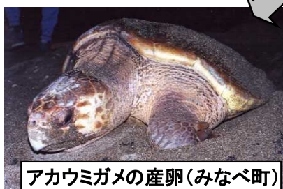
アカウミガメの産卵(みなべ町)

温暖多雨な県内には約2500種の植物、約7000種の昆虫が生育し、コウヤマキ・ナチマイマイ等の固有種や鳥類の希少種、アカウミガメの有数の産卵地も存在しています。