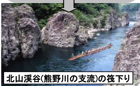
北山渓谷(熊野川の支流)の筏下り

県内の主な川には北から紀の川、有田川、日高川、日置川、古座川、熊野川等があります。紀伊山地南部を縫う清流は滝や淵などの渓谷美をつくり、生物の命を育みながら、太平洋に注ぎます。