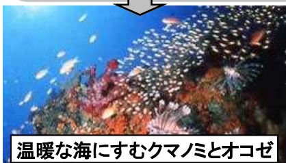
温暖な海にすむクマノミとオコゼ

県内には魚類が約1700種、貝類が3500種が存在、沿岸には海藻やアマモが多く、国内でも有数の多種多様な海洋生物が生息しています。