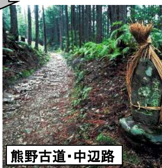
熊野古道・中辺路