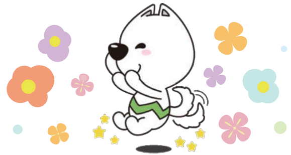
和歌山県PRキャラクター「きいちゃん」

会場の駐車場は台数が限られておりますので、 なるべく公共交通機関の御利用をお願いいたします。