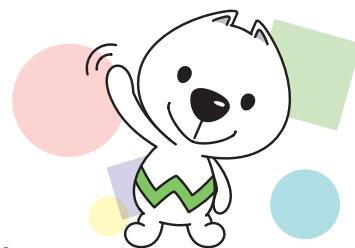
和歌山県PRキャラクター 「きいちゃん」