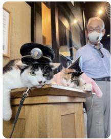
珍しくニタマ駅長とよんたま駅長が、長い間並んで一緒にいました。ニタマ駅長からよんたま駅長に、お仕事の様々な助言があったのかもしれない。

この8月、たま大明神の就任7周年を記念して、ニタマ宮司がピンクの衣装で祝意を表しました。また写真募集の一環で、よんたま駅長との写真撮影会も併せて開催され、とても賑やかな周年記念になりました。