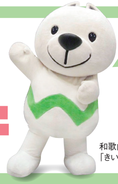
和歌山県PRキャラクター「きいちゃん」