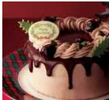
・チョコレートオーナメント