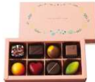
・チョコレートボンボン