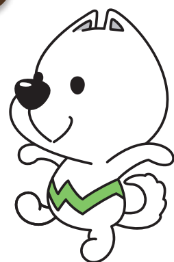
和歌山県PRキャラクター 「きいちゃん」

主催 和歌山県県産品建設資材登録事業者連絡会 【連絡先】 TEL 0736-64-8099