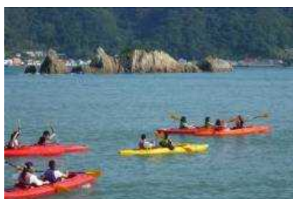
シーカヤック体験