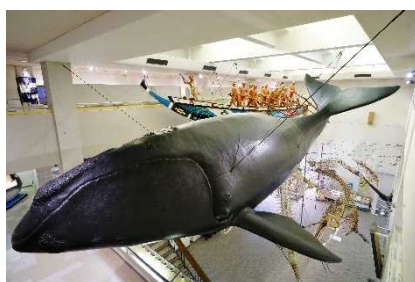
くじらの博物館学習プログラム