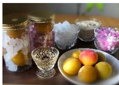
梅干・ジュース作り体験