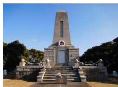
日本・トルコ友好の歴史ツアー