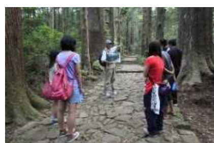
熊野古道ウォーク