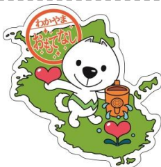
和歌山県PRキャラクター「きいちゃん」

県内中小事業者等が取り組む新事業展開に関する取り組みで事業の継続性、発展性が見込まれるプロジェクト