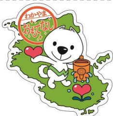
和歌山県PRキャラクター「きいちゃん」

県内中小事業者等が取り組む新事業展開に関する取り組みで事業の継続性、発展性が見込まれるプロジェクト