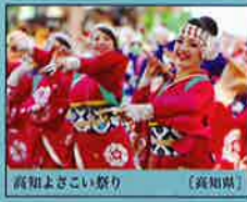
高知よさこい祭り