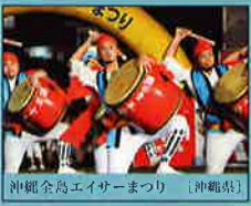
沖繩全島エイサーまつり