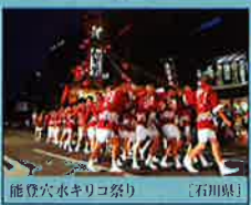
能登穴水キリコ祭り