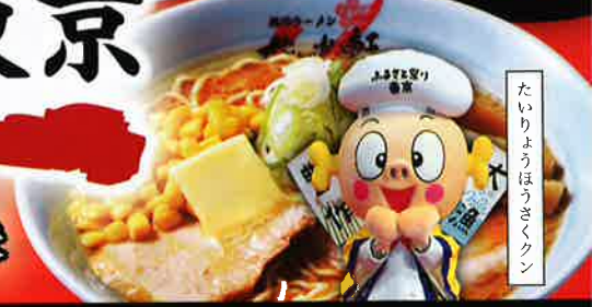
たいりょうほうさくくん