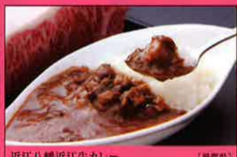
近江八幡近江牛カレー