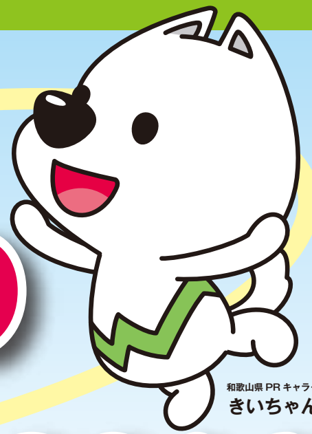
和歌山県PRキャラクター きいちゃん