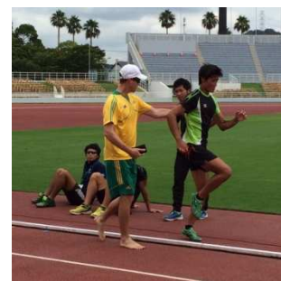
<代表チームコーチから指導を受ける本県国体強化指定選手の様子>