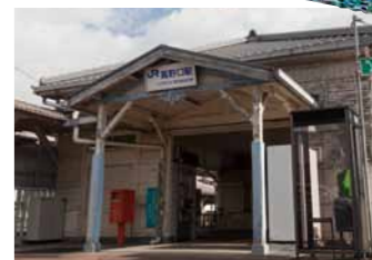
細い路地を抜けると、歴史を感じる建物を見つけた。人々の暮らしは現在も繋がっている。