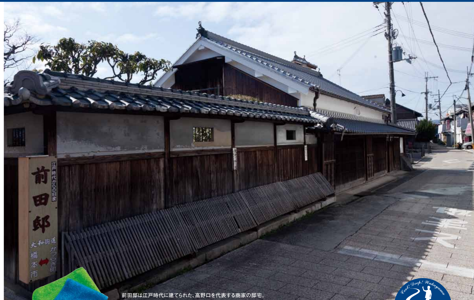
前田邸は江戸時代に建てられた、高野口を代表する商家の邸宅。

昭和初期に建てられた木造校舎で、今も小学生たちが学ぶ現役の高野口小学校。往事の繁栄ぶりがうかがえる立派な佇まいは、国の重要文化財に指定された。