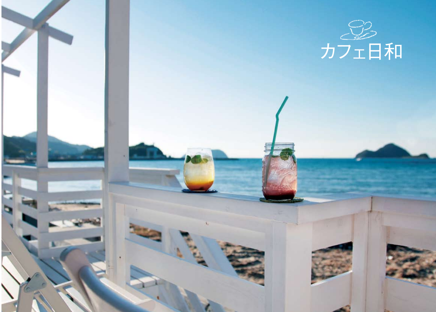
海に向かったテラスは開放感抜群。天気の良い日は潮騒をBGMに海岸の散歩もおすすめ。