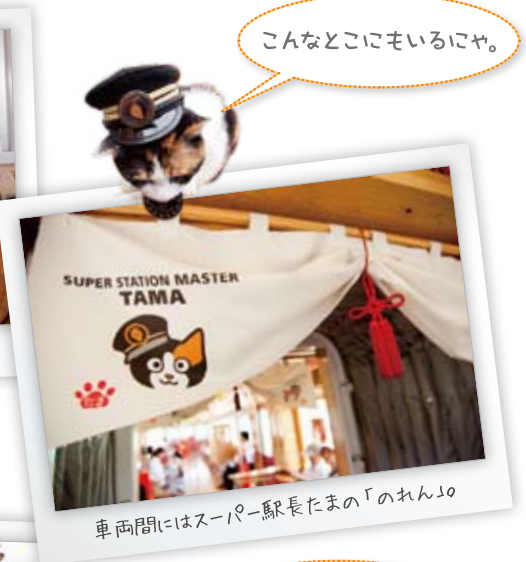
こんなところにもいるにや。