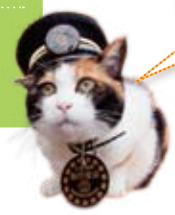
次回は駅舎を紹介するにや