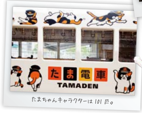
たまちゃんキャラクターは101匹の