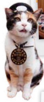
たまシレットの背もたれシートが可愛いよ