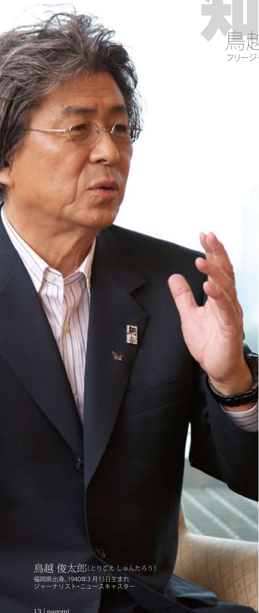
鳥越 俊太郎(とりごえ しゅんたろう) 福岡県出身。1940年3月13日生まれ ジャーナリスト・ニュースキャスター