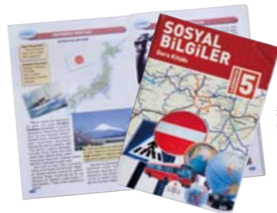
トルコ国内で使われている教科書。エルトゥール号についての記述が見られる。