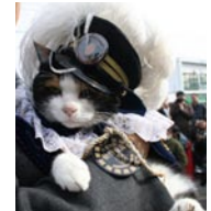
就任式で正装のたま駅長

2007年に駅長、2008年にはスーパー駅長(課長職)就任と順調に出世を続けるたま駅長。今年1月には和歌山電鐵の執行役員(エグゼクティブ・オフィサー)に就任しました。執行役員の報酬は、たま駅長から「これ以上食べる」とますますメタボになるとか。水戸岡鋭治さんデザインの駅舎「たまステーション」が就任のご褒美です。