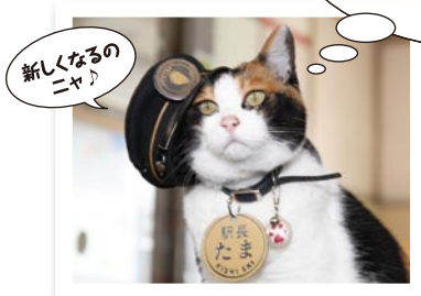
新しくなるのニャ!