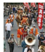
武者行列は総勢500名にもなる

関ヶ原の戦いに敗れた真田昌幸・幸村父子が隠れ住んだ里・九度山町。毎年5月5日、父子を偲んで武者行列が練り歩く「真田まつり」が開催される。今年は住民手作りの紙製の甲冑(真田の赤備え)も登場。問い合わせは、真田祭実行委員会(0736-54-2019)。また4月1日~5月5日には、端午の節句に因んだ「第2回町家人形めぐり」が行われ、町中の民家や商店などに貴重な人形が展示される。問い合わせは、九度山町観光協会(0736-54-2019)。