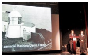
今年1月トルコで行われたオープニング式典の様子