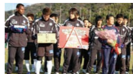
ヴァンフォーレ甲府の選手たち

サッカーJリーグ2部に所属する「ヴァンフォーレ甲府」(山梨)が1月18日~29日まで、和歌山市の紀三井寺陸上競技場で一次キャンプを行った。温暖な気候と競技場のピッチ(芝)が高く評価され実現。23日には仁坂知事が選手と関係者を激励のため訪問し、地元で捕獲されたジビエ料理の食材「イノシシ肉」と「プレミアム和歌山」認定の「大師の水」を贈った。