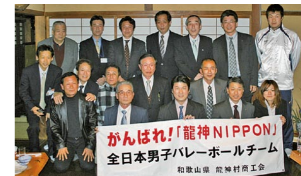
植田監督と「応援する会」の交流会の様子

2月10日、男子バレーボール日本代表「龍神NIPPON」の植田辰哉監督が、田辺市龍神村を訪れ「応援する会」と交流した。同会は昨年、男子バレーボール日本代表の愛称が「龍神NIPPON」に