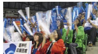
試合を応援するメンバーたち

2月10日、男子バレーボール日本代表「龍神NIPPON」の植田辰哉監督が、田辺市龍神村を訪れ「応援する会」と交流した。同会は昨年、男子バレーボール日本代表の愛称が「龍神NIPPON」に