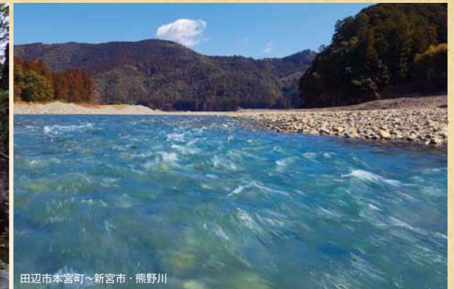
田辺市本宮町~新宮市・熊野川