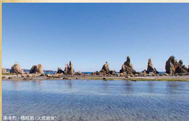
串本町・橋杭岩(火成岩体)

南紀熊野ジオパーク推進協議会 (和歌山県 自然環境室内) 住所/和歌山市小松原通1-1 電話/073-441-2780