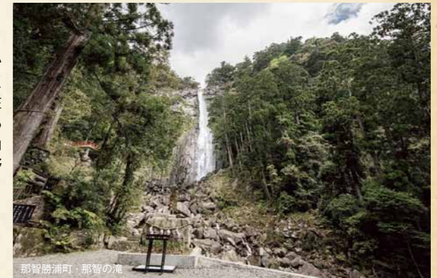
那智勝浦町・那智の滝

熊野信仰の基層にある自然崇拝。大いなる自然が与えてくれる恵みは神々しくもあり、時には畏怖せざるを得ない存在である。急峻な山々に樹々が生き茂る熊野は、人々は容易く近づけない。山や川、滝や巨岩、そして樹木など、熊野の自然と神の境界は混沌としている。