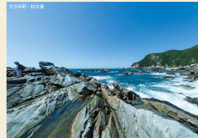
すさみ町・枯木灘