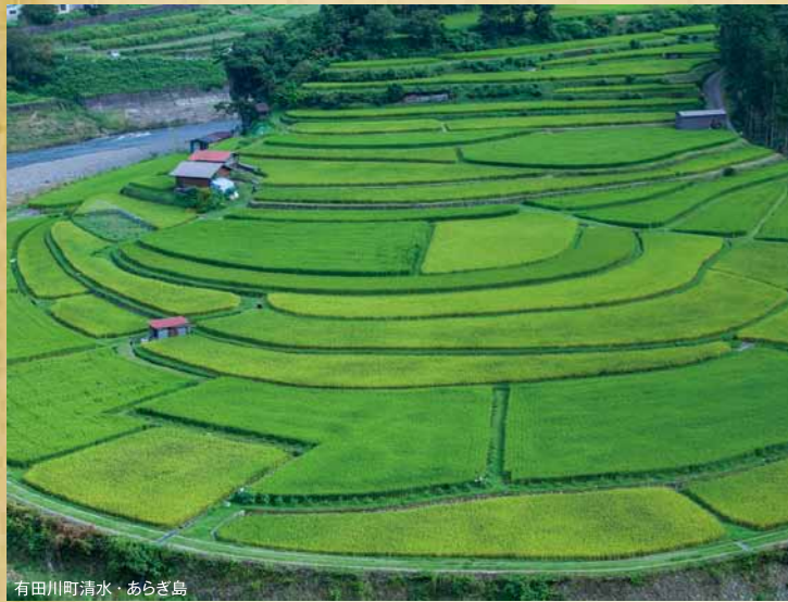
有田川町清水・あらぎ島