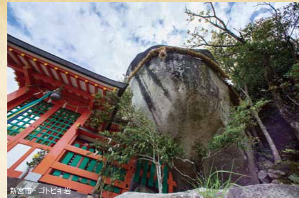
新宮市・コトビキ岩