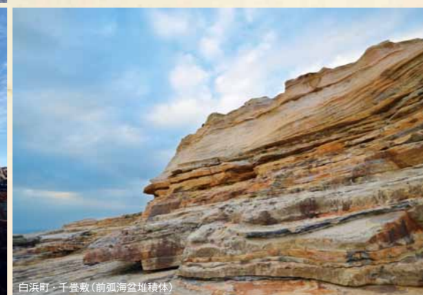
白浜町・千畳敷(前弧海盆堆積体)

バリエーションに富んだ和歌山の自然が描く絶景。しかし魅力はそれだけではない。神となり、人々の生活を描き、共に歴史を重ねてきた景観。途方もない時間の中で、そうあり続けた風景。和歌山の自然には文化が宿っている。