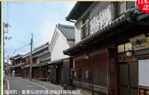
湯浅町・重要伝統的建造物群保存地区