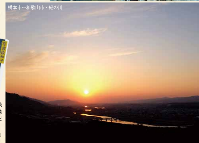
橋本市~和歌山市・紀の川