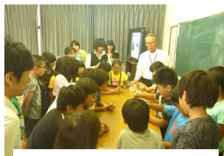
下水道出前授業での活動状況