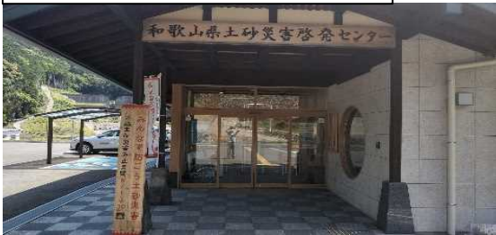
啓発センター入口（土砂災害防止月間の看板）