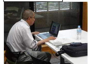
オンライン学習の様子

学習内容は、紀伊半島大水害の概要や新座柳瀬高等学校の近くにある新柳瀬川での水害について説明し、早めの避難行動について学習しました。