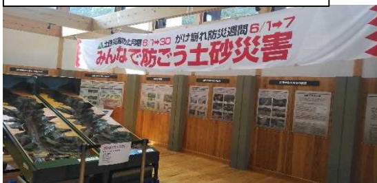
啓発センター展示室（土砂災害防止月間の横断幕）