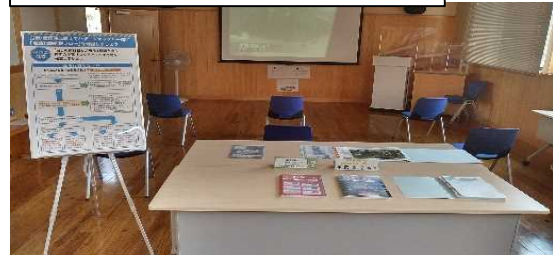
啓発センター研修室（ハザードマップの展示）