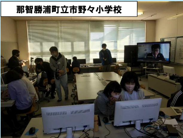
那智勝浦町立市野々小学校