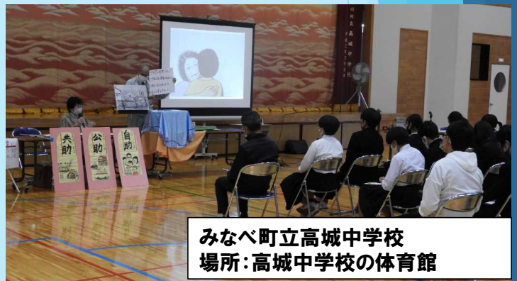
みなべ町立高城中学校 場所：高城中学校の体育館