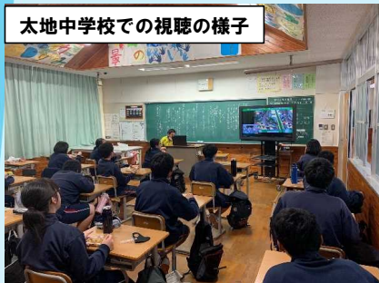
土石流模型実験をオンラインにより生配信