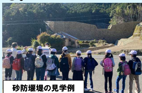
砂防堰堤の見学例