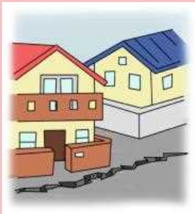
地面にひび割れや 段差ができる