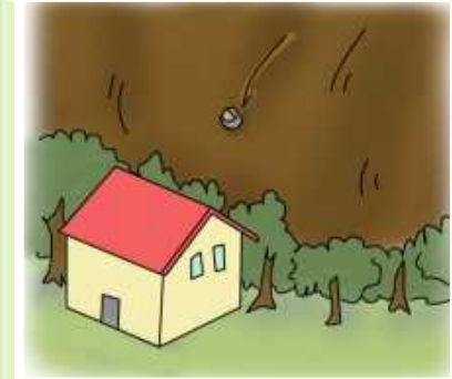
がけから小石が ぼろぼろ落ちてくる