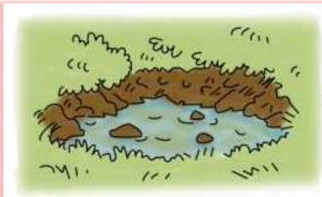
池の水が濁ったり急に減ったり 増えたりする