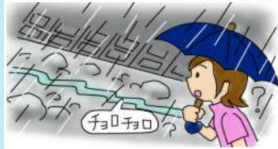
雨が降り続けているのに 川の水量が減っている