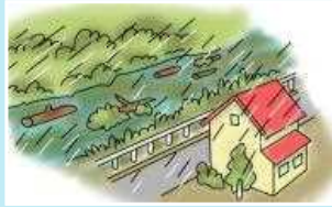
川が異常に濁り、 流木が混じっている

土砂災害が発生する時には、 前兆現象 が確認されることが多いので普段と違う現象を確認した場合は 速やかに避難 するよう心がけて下さい。