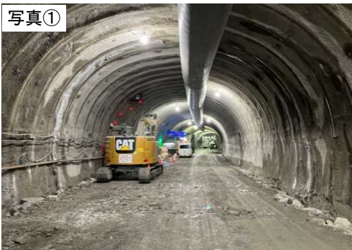
令和6年3月末現在(施工状況)