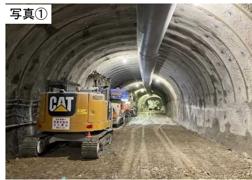
令和6年4月末現在(施工状況)